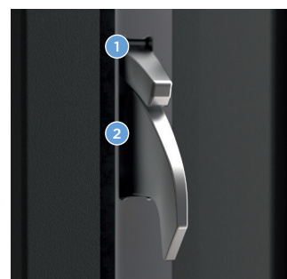
Dichtheids-element (1) geactiveerd, haakschoot (2) schuift uit en grijpt diep achter de sluitlijst in.

Winkhaus Nederland B.V. · Wapenrustlaan 11-31 · NL-7321 DL Apeldoorn Aug. Winkhaus GmbH & Co. KG · Berkeser Straße 6 · D-98617 Meiningen